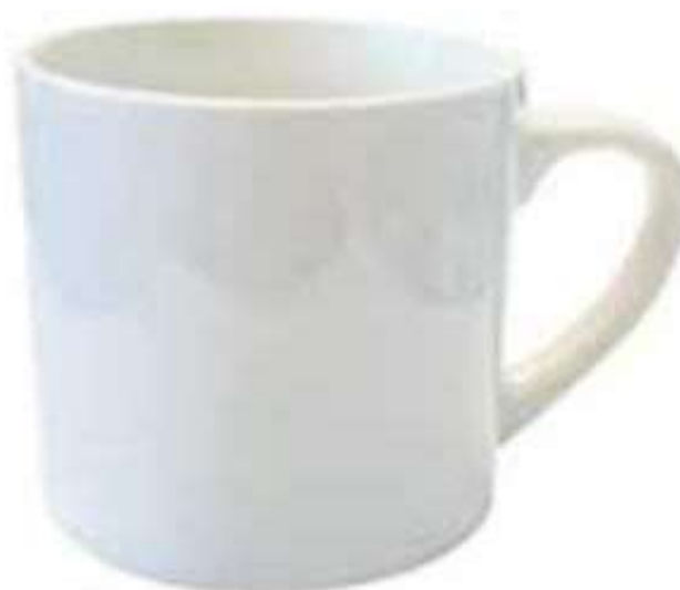
Taza Blanca 6oz