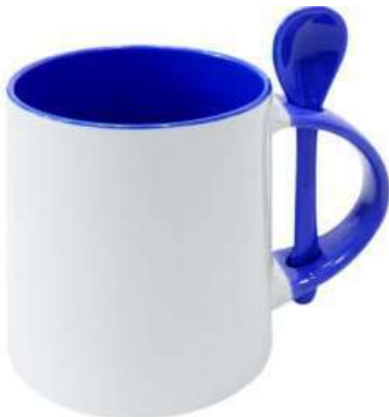
Taza Base Redonda Con Cuchara 11oz colores disponible; rojo, negro, verde