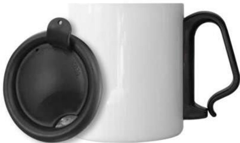
Taza C/Tapa Acero Inoxidable Blanco 350ml