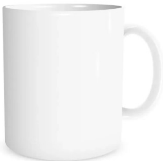
taza de 11 oz