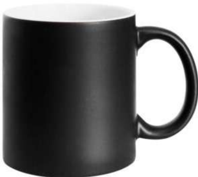
Taza Mágica Mate Negra 11 Oz