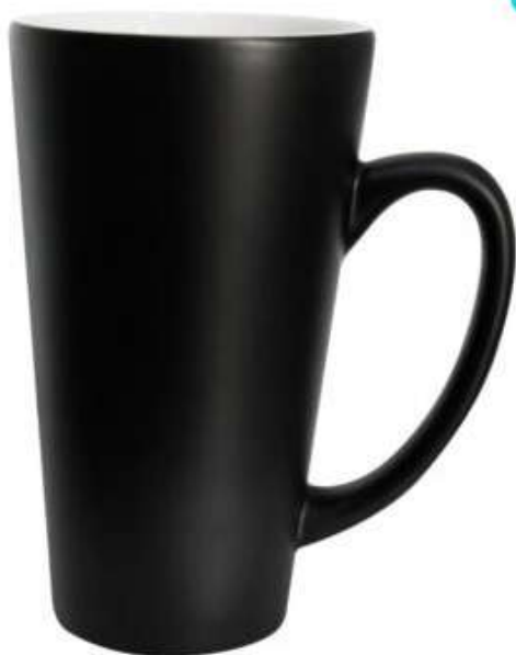
Taza Cónica Mágica Negro 17oz